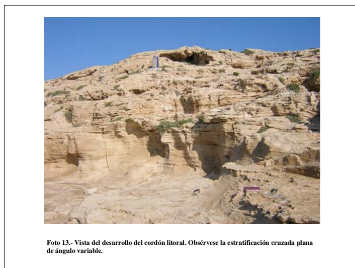
Foto 13.- Vista del desarrollo del cordón litoral. Obsérvese la estratificación cruzada plana de ángulo variable.